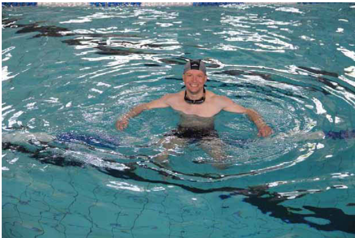
(Тренировка по плаванию в Рязани)

Проект «Трансплант Спорт». В 2023 г. МООНП «НЕФРО-ЛИГА» получила грант Президента Российской Федерации на развитие гражданского общества, предоставленного Фондом президентских грантов. В ходе реализации проекта в Забайкальском крае, Республиках Бурятия, Саха (Якутия), Башкортостан, Татарстан, в Свердловской, Рязанской и Челябинской областях, в Москве и Санкт-Петербурге был организован регулярный тренировочный процесс (дартс, настольный теннис, плавание, боулинг, футбол), проведены региональные и межрегиональные турниры.