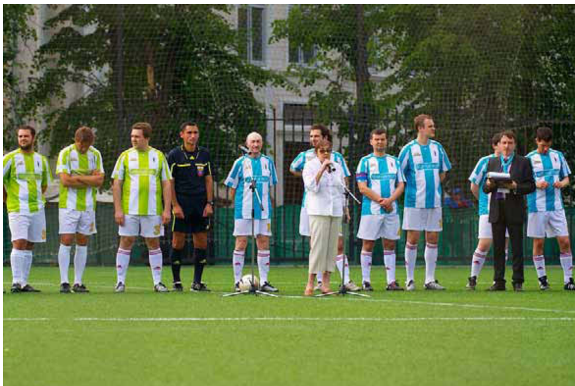
Акция «Люди ради людей», Москва, 2011

С 2011 по 2016 г.г. в Москве (в 2015 – в Санкт-Петербурге), при поддержке Первого Московского государственного медицинского университета им. И.М. Сеченова, Российского трансплантологического общества и Национального альянса медицины и спорта «Здоровое поколение» проводилась общественная благотворительная акция в поддержку трансплантологии и органного донорства «Люди ради людей». В рамках акции проводился необычный товарищеский мини-футбольный матч. В таких матчах принимали участие игроки-реципиенты почек, печени, поджелудочной железы и сердца. Все футболисты-реципиенты прошли медицинское обследование и получили допуск к занятию физической культурой и участию в футбольном матче.